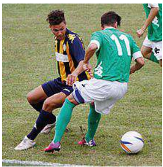
Una partita dell'Union ViPo

Note: espulso Conte al 19' st, ammoniti Toniolo, Zane.