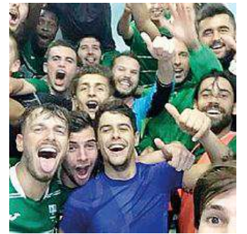
La gioia dei giocatori